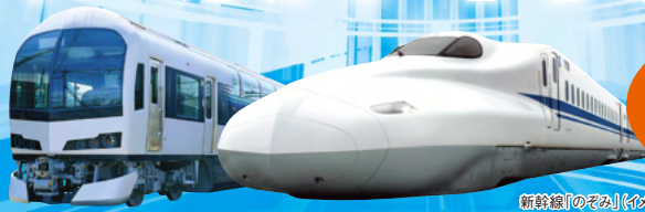
新幹線「のぞみ」(イメージ)