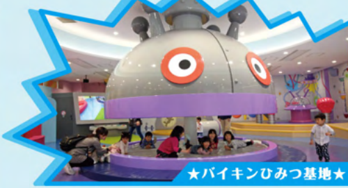
★バイキンひみつ基地★