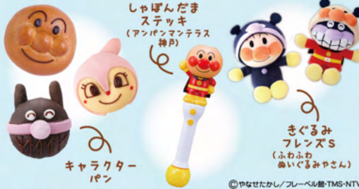
しゃぼんだまステッキ (アンパンマンメンテラス神戸) キャラクターパン