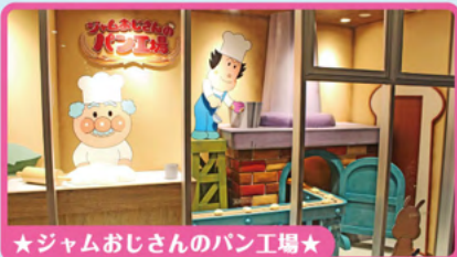
★ジャムおじさんのパン工場★