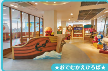
★おでむかえひろば★