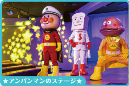
★アンパンマンのステージ★

「それいけ! アンパンマン」のテーマパーク。 アンパンマンたちのステージやグリーンイングも毎日開催!