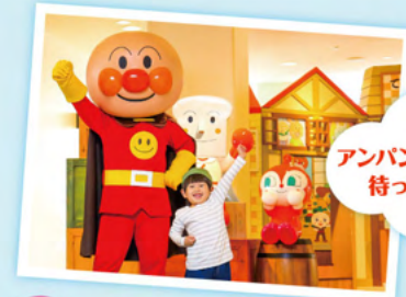
アンパンマンたちも待ってるよ!